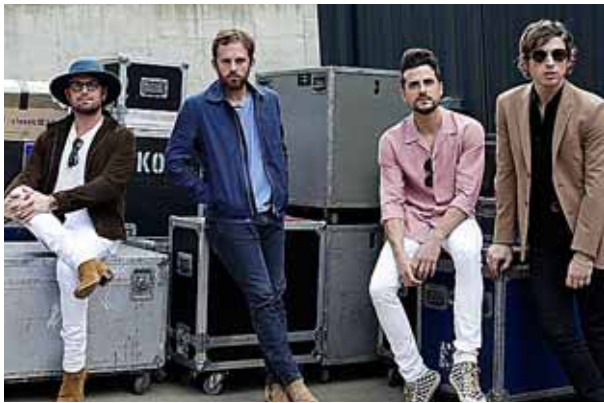
Imagen de los integrantes del grupo Kings of Leon.