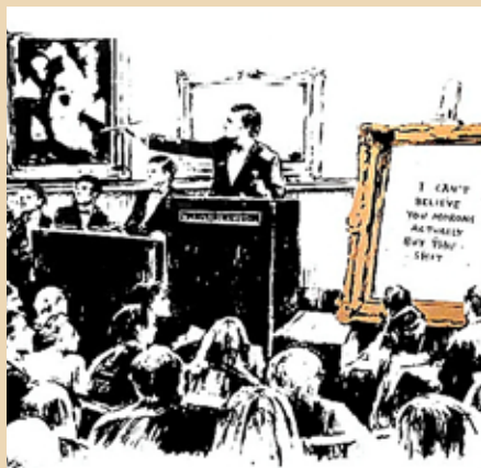
Recreación de 'Moron's', la pieza de Banksy que, una de sus láminas, fue quemada por cripto inversores.