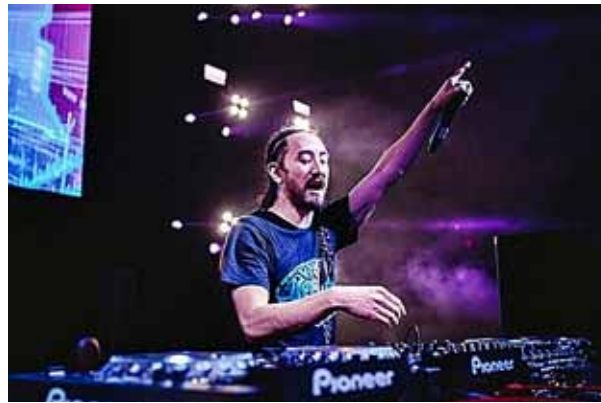
Steve Aoki durante una de sus actuaciones.

La banda de rock estadounidense Kings of Leon recaudó más de 2 millones de dólares por la subasta de la colección de 'tokens no fungibles' (NFT), que salió a la venta en febrero de 2020, como parte del paquete promocional de su nuevo álbum 'When You See Yourself'. La venta fue catalogada como histórica por tratarse de la primera banda que usó la red de Ethereum para lanzar su trabajo musical. La empresa Yellowheart se encargó del desarrollo de la versión 'tokenizada' del álbum que incorpora características especiales como una portada digital en movimiento.