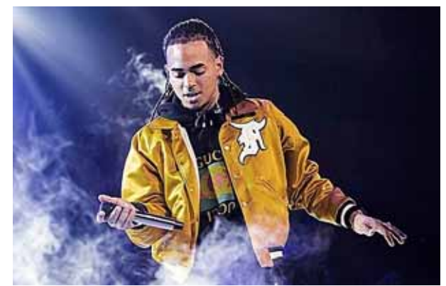
El cantante puertorriqueño Ozuna.

El primer acercamiento de Steve Aoki al mundo de los NFT fue con la venta de 'Dream Catcher', una colección audiovisual de 11 piezas, en la plataforma Nifty Gateway a principios de 2020. En agosto del pasado año, el DJ se unió al equipo de Stoopid Buddy Stoodios, una compañía y estudio de animación, para el lanzamiento de DOMINION X, una serie basada en el personaje Character X, surgido en 'Dream Catcher'. La música de la serie está a cargo de Steve Aoki y los fans pueden comparar piezas del guión de la serie y de algunos 'beats' de las composiciones de Aoki.